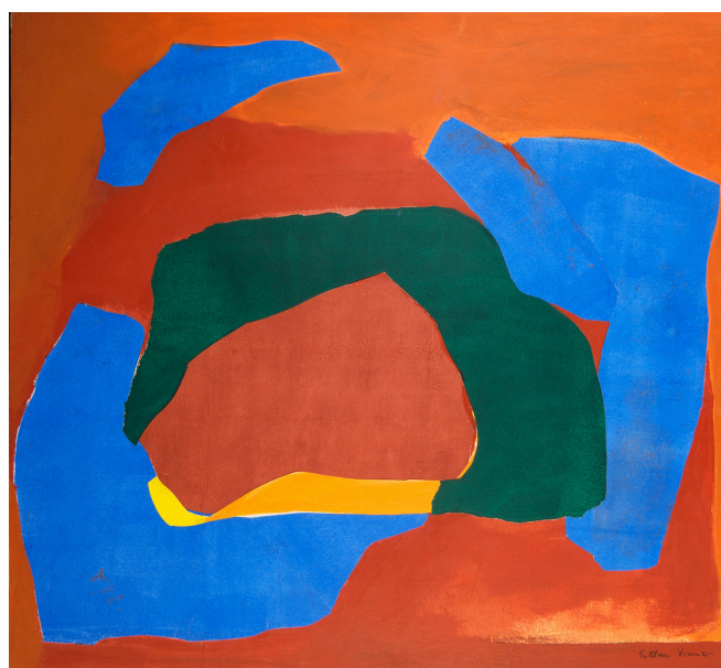
Esteban Vicente, Mota , 1968. Collage , papel sobre cartón pluma.

“Para mí la pintura tiene que ser austera y, de alguna manera, pobre, pobre en recursos. No me gusta la pintura lujosa. Cuando miramos hacia atrás, a la pintura del Renacimiento italiano o a Rubens, especialmente a Rubens, tan suntuoso. No me gusta eso. Por pobre entiendo limitada, parca, exigua. Soy verdaderamente muy anti-barroco”. 1