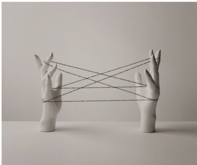
Sin título, 2014. 50 x 60 cm | 19,6 x 23,6 in. Fotografía B/N sobre papel baritado, virado al sulfuro

Hermanos Álvarez Quintero, 1 T +34 91 319 59 00 galeriaelvira Gonzalez.com 28004 Madrid