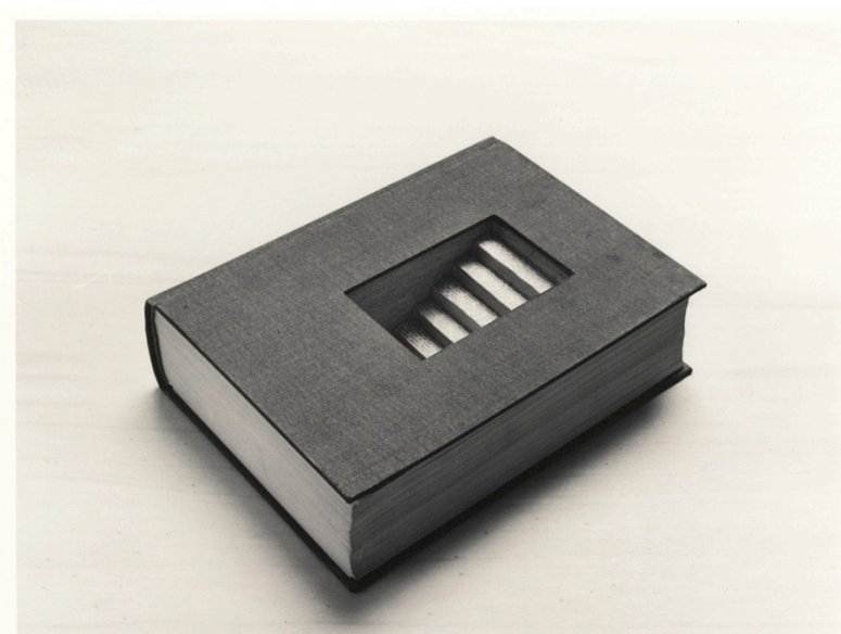
Sin título, 2014. 50 x 60 cm | 19,6 x 23,6 in. Fotografía B/N sobre papel baritado, virado al sulfuro

22 de enero de 2015 - 18 de marzo de 2015