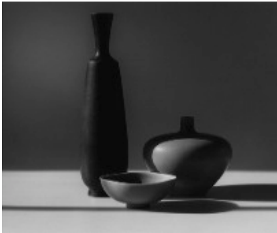
RM Glass Collection , 1984, 50,3 x 40,5 cm

La muestra, que podrá visitarse en la Galería Elvira González hasta el próximo 19 de julio, forma parte del Festival Off PHotoEspaña 2013.