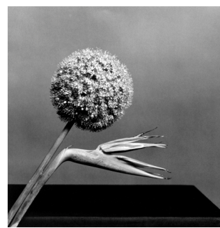
Bird of Paradise, 1979